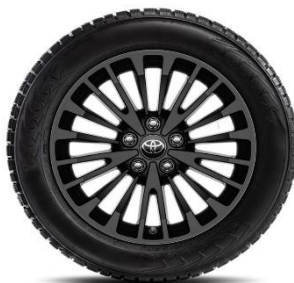
Комплект зимни гуми Bridgestone с алуминиеви джанти 17"

Пепелник 7410202140 34.00 € 66.50 лв. Монтажен к-кт 7412802020 14.00 € 27.38 лв.