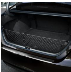
Мрежа за товар – вертикална