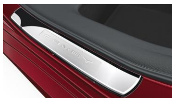
Светещи лайсни за праговете