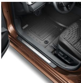
Гумени стелки за купето