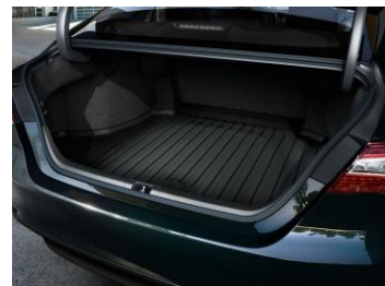
Гумена стелка за багажника