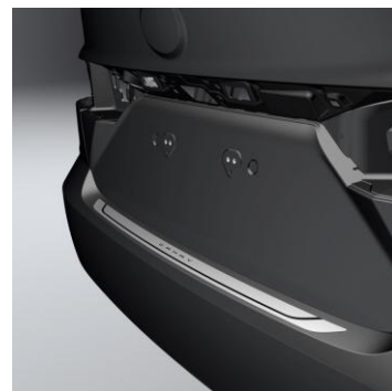
Предпазна лайсна за задната броня – стоманена