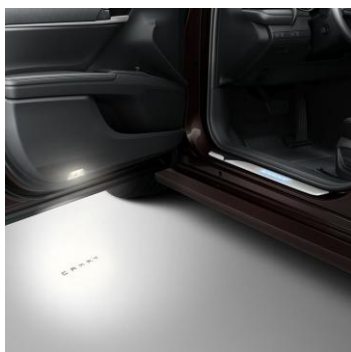
Плафон със светещ надпис за предните врати