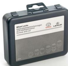
Секретни гайки за джанти