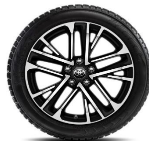
Комплект зимни гуми Bridgestone с алуминиеви джанти 18"