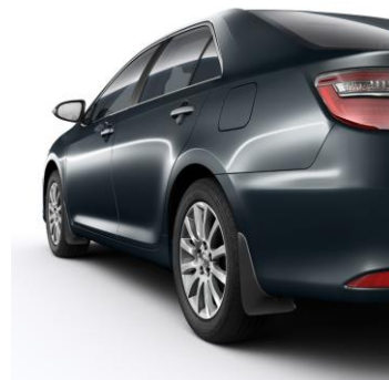
Калобрани предни + задни