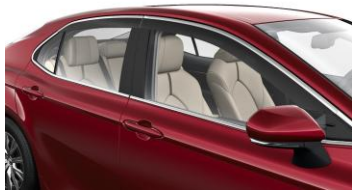
Дефлектори за вятър (к-кт за страничните стъкла)