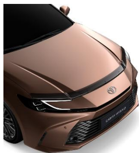
Дефлектор за преден капак